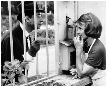
1963 L'ASSASSIN CONNAÎT LA MUSIQUE de Pierre Chenal avec Paul Meurisse