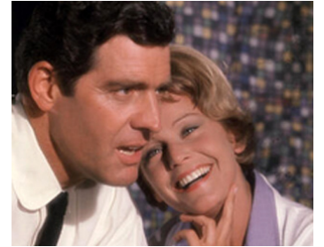
1962 JE NE SUIS QU'UNE FEMME (Ich bin auch nur eine Frau) d'A. Weidenmann avec P. Hubschmid