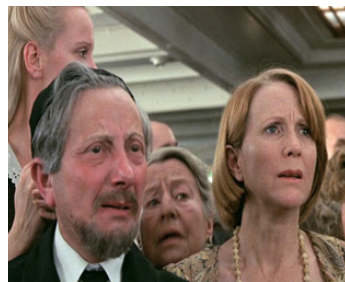
1976 LE VOYAGE DES DAMNÉS (Voyage of the Damned) de S. Rosenberg avec Nehemia Persoff