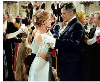
1960 LA RUÉE VERS L'OUEST (Cimarron) d'Anthony Mann avec Glenn Ford