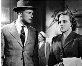
1953 JOURNAL D'UNE AMOUREUSE (Tagebuch einer Verliebten) de J. von Baky avec O. W. Fischer