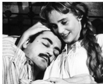
1956 GERVAISE de René Clément avec François Périer