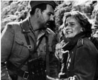
1954 LE DERNIER PONT (Der letzte Brücke) de Helmut Käutner avec Bernhard Wicki