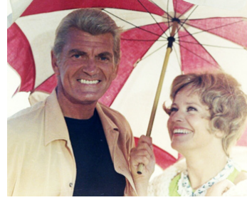
1969 LA PROVOCATION d'André Charpak avec Jean Marais