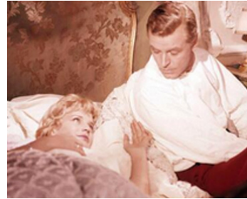
1961 LA GRANDE ROUE (Das Riesenrad) de Geza von Radvanyi avec O. W. Fischer