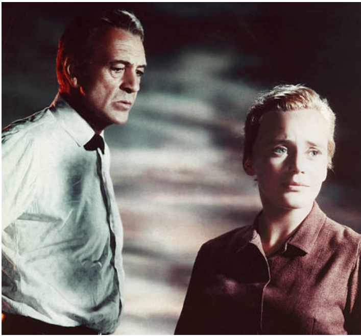
1959 LA COLLINE DES POTENCES (The Hanging Tree) de Delmer Daves avec Gary Cooper