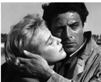
1956 LOVE (Liebe) de Horst Hächler avec Raf Vallone