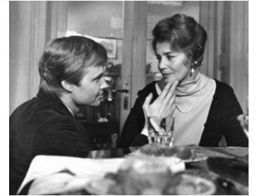
1974 LE DOSSIER ODESSA (The Odessa File) de Ronald Neame avec Jon Voight