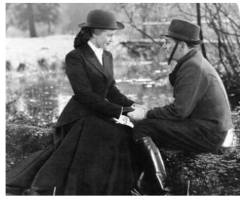
1948 MARESI (Maresi) de Hans Thimig avec Attila Hörbiger