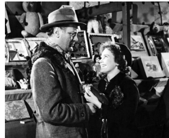
1955 LES RATS (Die Ratten) de Robert Siodmak avec Curd Jürgens