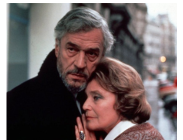
1985 MILLE NEUF CENT DIX-NEUF (1919) de Hugh Brody avec Paul Scofield