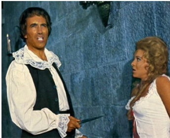
1970 LE TRÔNE DE FEU (Il Trono di Fuoco) de Jesus Franco avec Christopher Lee