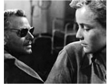
1953 TANT QUE TU M'AIMERAS (So lange du bist) de Harald Braun avec O. W. Fischer