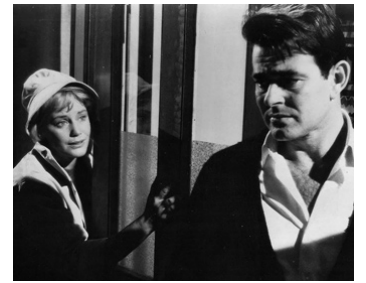
1961 LA MARQUE (The Mark) de Guy Green avec Stuart Whitman