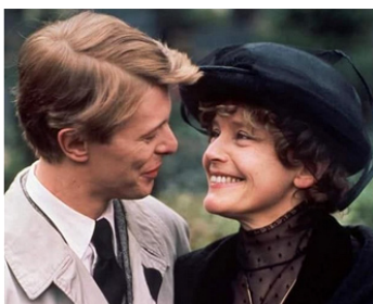
1979 C'EST MON GIGOLO (Schöner Gigolo, armer Gigolo) de David Hemmings avec David Bowie