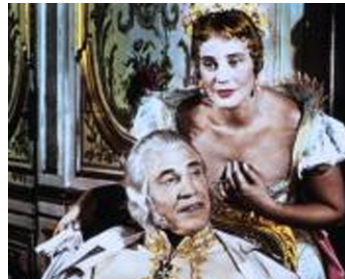
1955 NAPOLÉON de Sacha Guitry avec Fernand Fabre