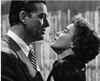
1953 DREAMING LIPS (Der Träumende Mund) de Josef von Baky avec Fritz von Dongen