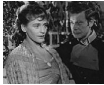
1950 C'EST ARRIVÉ UN JOUR (Es kommt ein Tag) de Rudolf Jugert avec Dieter Borsche