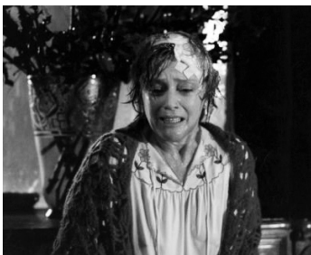
1976 FOLIES BOURGEOISES de Claude Chabrol