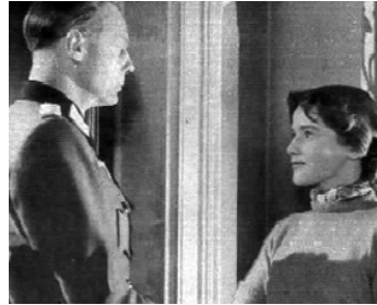
1952 JE NE SUIS PAS UNE HÉROÏNE (So little Time) de Compton Bennett avec Marius Goring