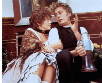
1972 LE PRESBYTÈRE EN FOLIE (Die Pfarrhauskomodie) de et avec Veit Relin