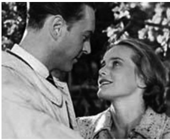
1948 L'ANGE À LA TROMPETTE (Der Engel mit der Posaune) de Karl Hartl avec Hans Holt