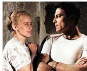
1957 ROSE BERND (Rose Bernd) de Wolfgang Staudte avec Raf Vallone