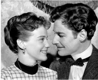
1951 LA BOÎTE MAGIQUE (The Magic Box) de John Boulting avec Robert Donat