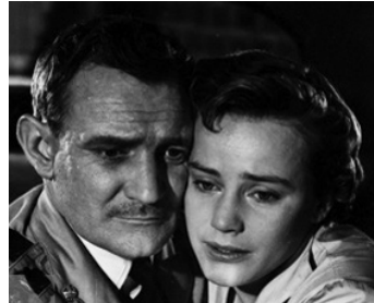
1953 LE FOND DU PROBLÈME (The Heart of the Matter) de G. More O'Ferrall avec T. Howard