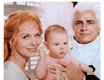
1978 SUPERMAN (Superman) de Richard Donner avec Marlon Brando