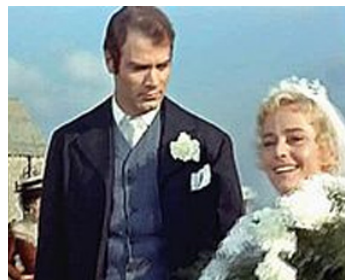
1958 UNE VIE d'Alexandre Astruc avec Christian Marquand