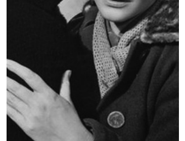
1957 NUITS BLANCHES (Le Notti Bianche) de Luchino Visconti