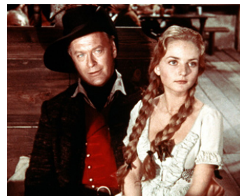
1958 LE BANDIT AU GRAND CŒUR (Der Schinderhannes) de H. Käutner avec C. Jürgens