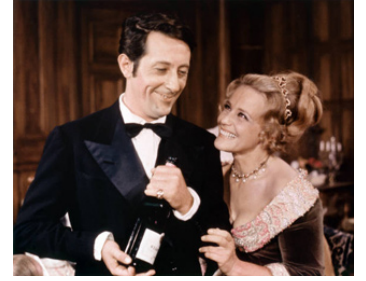
1969 LE DIABLE PAR LA QUEUE de Philippe de Broca avec Jean Rochefort