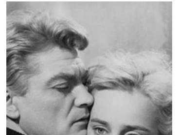
1957 NUITS BLANCHES (Le Notti Bianche) de Luchino Visconti