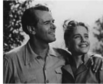
1952 BIS WIR UNS WIEDERSEHN de Gustav Ucicky avec O. W. Fischer